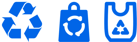
从自然环境中回收材料