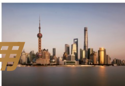
工业产品流入城市 抵达消费者