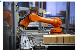
材料再加工为产品