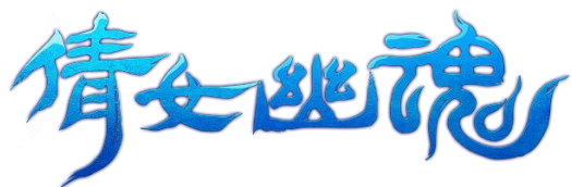
网易《倩女幽魂》手游