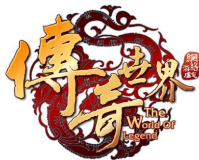
国民游戏《传奇世界》