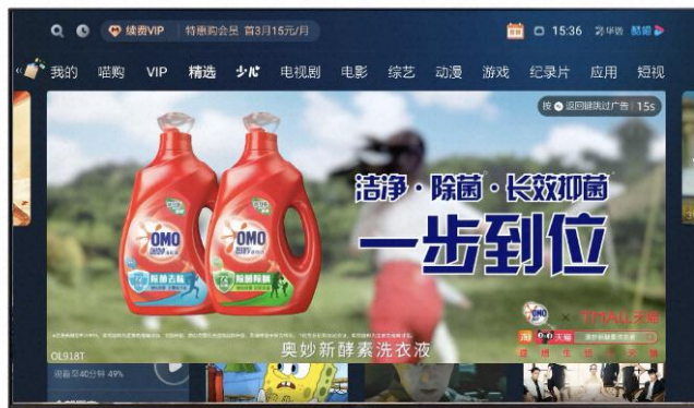
【VideoBanner】 首页弹出电影质感，覆盖更广用户