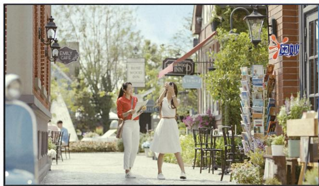
【开机视频】 抢占用户开机第一视觉