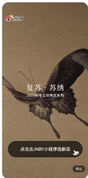
- 开机优选触达 -