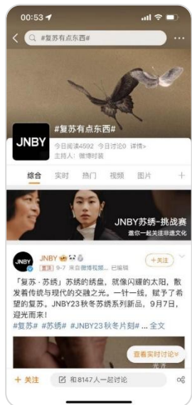
- 品牌话题 -