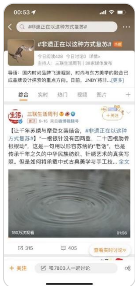
- 媒体话题 -