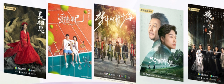
在投期间Super剧场覆盖部分剧单