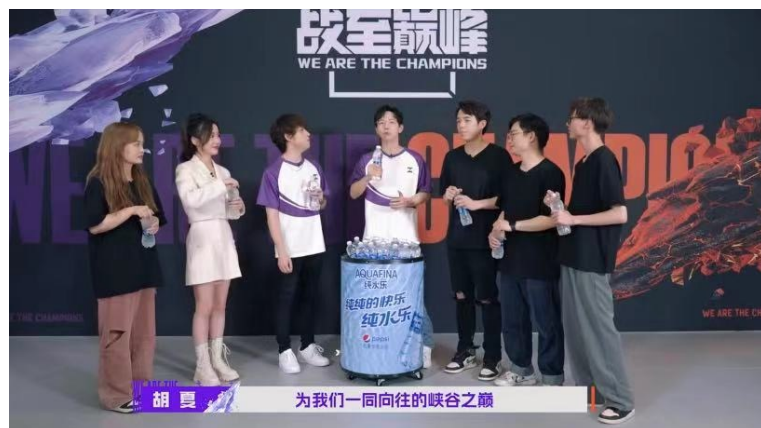
胡夏 为我们一同向往的峡谷之巅