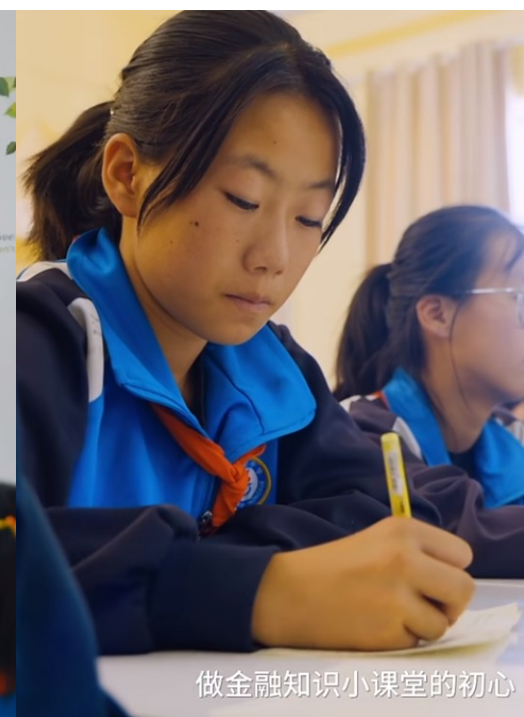
做金融知识小课堂的初心