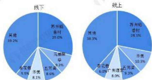
图表4：2020年中秋中国月饼销售份额(单位：%)